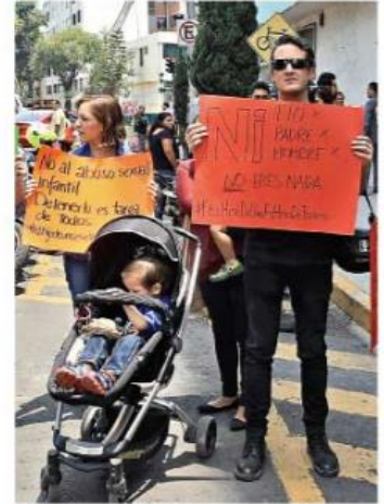
Padres del colegio Matatena denunciaron en abril abusos sexuales contra sus hijos.

El colegio Matatena, ubicada en Augusto Rodin 398 Colonia Extremadura Insurgentes, Delegación Benito Juárez, ya fue clausurado por la Secretaría de Educación Pública.