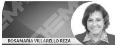
ROSAMARÍA VILLARELO REZA