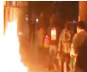
5 de febrero de 2013. El mismo vándalo incendió la dirección del CCH Naucalpan y amenazó con quemar a 5 maestros.

y daño en propiedad ajena al quemar instalaciones del Colegio de Ciencias y Humanidades (CCH) de Naucalpan.