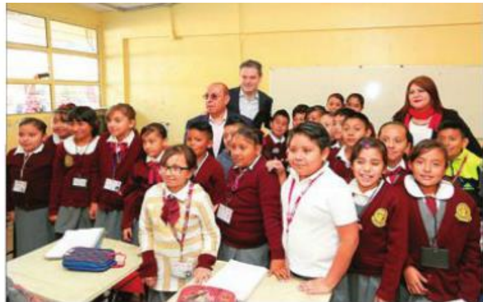
El titular de la SEP, Aurelio Nuño, visitó la escuela primaria Emperador Cuauhtémoc, en la delegación Gustavo A. Madero.

Nuño Mayer precisó que con la evaluación del pasado fin de semana más quienes hicieron lo propio en noviembre pasado, suma ya 76 por ciento de los maestros que han cumplido con ese derecho, es decir, poco más de 4 mil maestros participaron y cum-