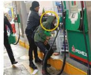
1 de diciembre de 2012. El Chómpiras fue captado al momento de saquear una gasolinera durante las manifestaciones.

Algunos de los actos que han protagonizado los vándalos.