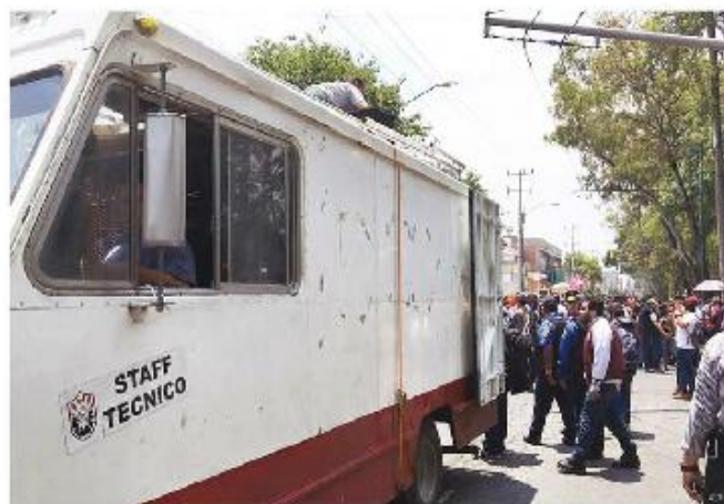
VEHÍCULO del SME encabezó ayer la movilización en la unidad Zacatenco.

LOS ELECTRICISTAS, PRESENTES en movilizaciones del CNTE, gritaron arengas contra director del Poli; se mantiene el paro en la mayoría de las vocacionales