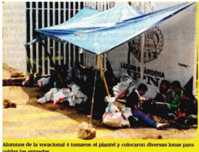
Alumnos de la vocacional 4 tomaron el plantel y colocaron diversas lonas para cerrar las entradas.

En diversos planteles tanto de nivel medio superior como superior, estudiantes del Instituto Politécnico Nacional realizaron paros de labores, parciales en algunos, totales en otros. La demanda de los jóvenes gira en torno a la reciente modificación de adscripción del Instituto, que pasó de la Subsecretaría de Educación Superior a la oficina del titular de la Secretaría de Educación Pública. Los estudiantes piden que se informe de las implicaciones tanto académicas como administrativas de esa decisión, pese a que la SEP insiste en que la estructura de la institución no se modifica.