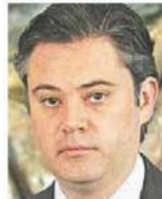
Aurelio Nuño Mayer Secretario de Educación Pública

● El funcionario anunció que 3 mil 360 maestros que no se evaluaron serán cesados, por no haberse presentado a ninguna de las fases de la evaluación de desempeño docente. Nuño aseguró que el 48.5 por ciento de los maestros obtuvo el rango de excelente, destacado y bueno, mientras que el resto obtuvo nivel de insuficiente y suficiente.