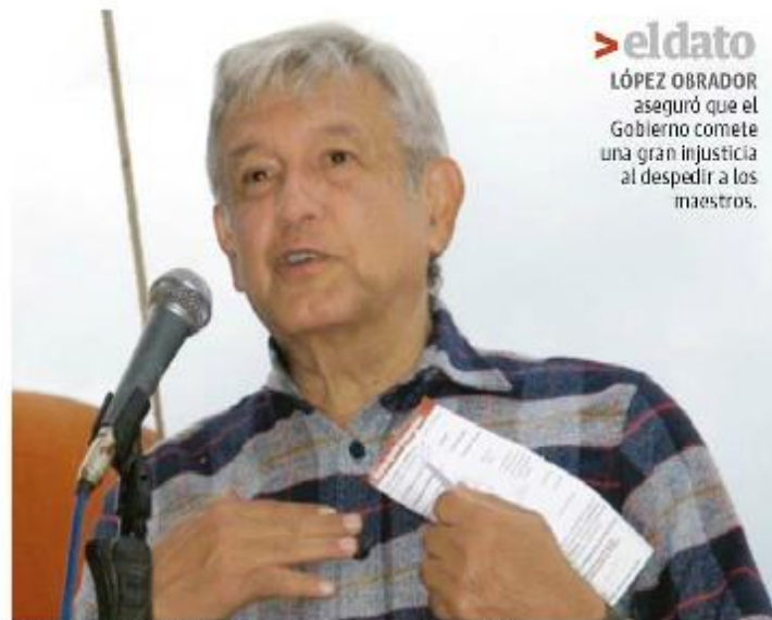
EL TABASQUEÑO habló, el miércoles, del tema de los maestros que serán despedidos.

Para asegurar el acuerdo con la Sección 22, Morena ofreció también presidencias municipales.