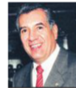
René Avilés Fabila