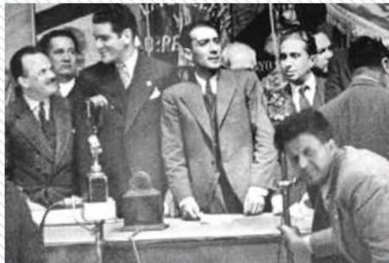
Vicente Lombardo Toledano (centro), durante la inauguración de la Universidad Obrera de México, en 1936.

Esta institución operó durante 79 años sin un documento oficial que validara su existencia, hasta el 13 de agosto pasado, cuando la administración de Enrique Peña Nieto le otorgó el decreto presidencial que le da existencia legal como una institución de enseñanza con subsidio público.