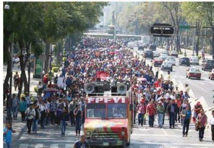
MAESTROS marcharon de Los Pinos al Zócalo, el viernes.

$25,962,639 pesos de descuentos representan