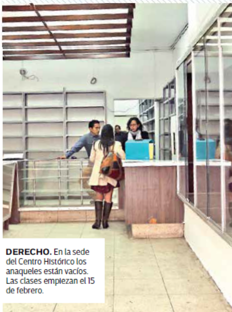
DERECHO. En la sede del Centro Histórico los anaqueles están vacíos. Las clases empiezan el 15 de febrero.