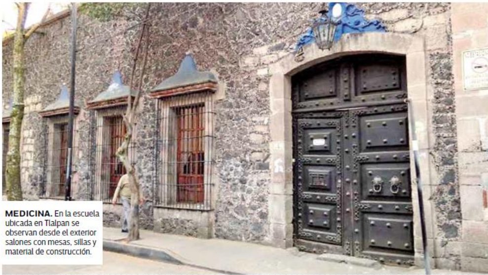
MEDICINA. En la escuela ubicada en Tlalpan se observan desde el exterior salones con mesas, sillas y material de construcción.

"En los estatutos de Morena está que la mitad de nuestro sueldo se dona y en este caso se dona al proyecto educativo, entonces está perfectamente garantizado. Además, como Morena va a crecer mucho electoralmente este año, nos va a ir mejor, va a haber más recursos públicos y más dinero para las escuelas",