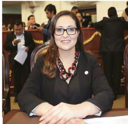
LA DIPUTADA priista durante una sesión en la Asamblea Legislativa.

LA ASAMBLEÍSTA de la Comisión de Educación dará a capitalinos diagnóstico sobre calidad de primarias, secundarias...; quieren revisar cuentas de UACM