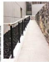
El espacio busca satisfacer necesidades académicas.

moniza. Fue un recurso que se invirtió ahí, pero lo importante es la eficiencia de la educación que se da ahí que es de posgrado. Los académicos se deben de poner de acuerdo, pero eso lo debieron haber visto desde antes".