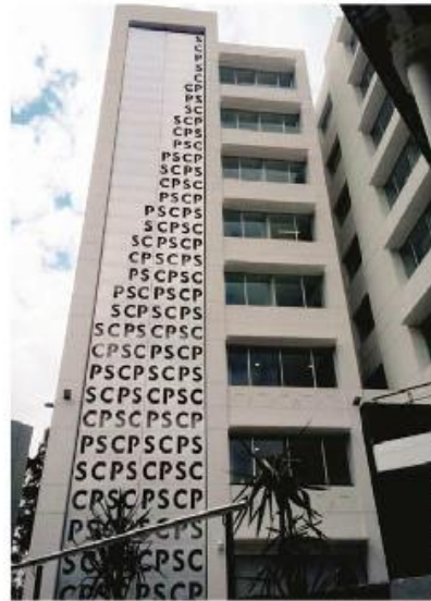
La construcción cuenta con oficinas de académicos y salones de posgrado.

El inmueble está dentro de la Facultad de Ciencias Políticas y Sociales