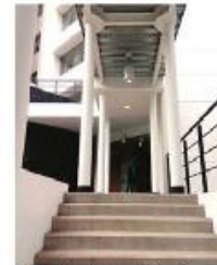
Sin actividad estudiantil está el inmueble.