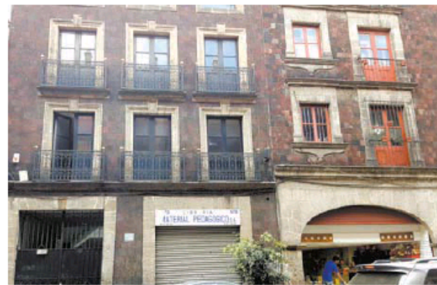
La Escuela de Derecho, en la Cuauhtémoc, sin registro.

"Son positivos todos los esfuerzos que apunten a darle alternativa a todos los jóvenes para que puedan estudiar; la apuesta de este gobierno es que los jóvenes