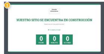
2 Al dar click en un enlace para consultar los programas de las carreras que ofrecerán las universidades, sólo aparece una pantalla en la que se señala que el sitio está en construcción