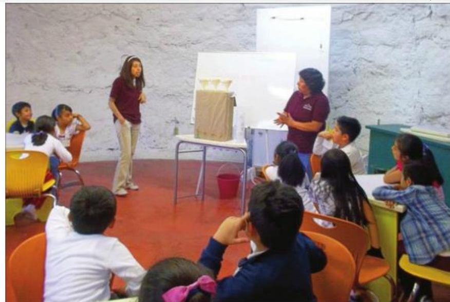
ACTIVIDAD LÚDICA en torno a un fenómeno natural en los talleres de Pauta.

Una peculiaridad del trabajo actual de Pauta es que no incorpora únicamente a los niños que obtienen notas de 9 o 10. Mu-