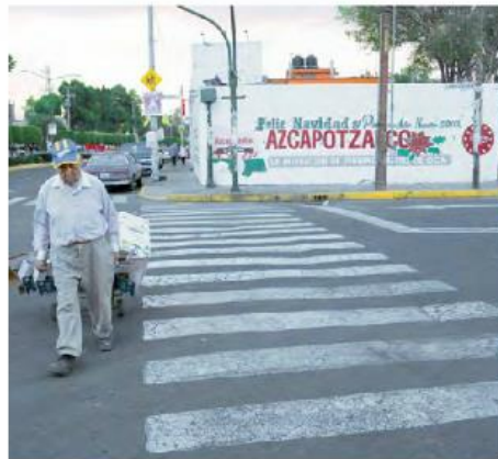
Azcapotzalco. En el cruce que señala el mapa, Avenida 22 de febrero y Mecoaya, hay un lote baldío cercado por una barda.

Los aspirantes deben hacer su solicitud mediante una carta en la que expresen su interés de estudiar en alguna de las escuelas, y sólo se realiza vía email, por lo que los aspirantes no pueden acudir a las instalaciones. Tampoco se proporciona teléfono para pedir informes.