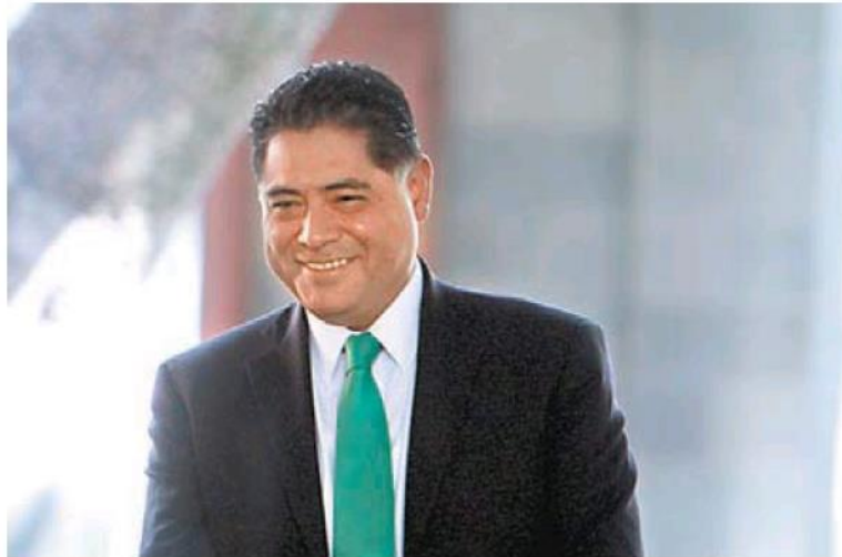
El mandatario estatal acudió ayer a la residencia oficial de Los Pinos.

Entrevistado en la residencia oficial de Los Pinos, comentó que se debe trabajar para que se respete la dignidad y