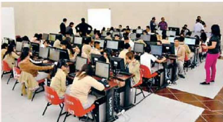
El sistema permite evaluar a los egresados de secundaria.

En marzo de este año se realizó la prueba piloto del simulador en la Coordinación General de Formación e Innovación Educativa (Cgfi) del IPN, con un sistema inteligente que contaba con 200 reactivos por área de conocimiento, para un examen de preguntas aleatorias, lo que garantiza