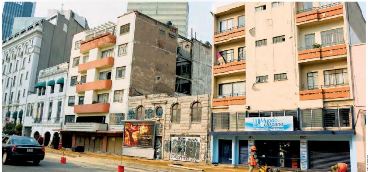
Plantel de la delegación Cuauhtémoc. La página web de Morena refiere que la universidad se ubicará en la calle Morelos, pero no menciona el número; sólo el predio de menor altura podría albergar la escuela, pues el resto de los inmuebles tiene otro uso, como habitacional y servicio de hospedaje.