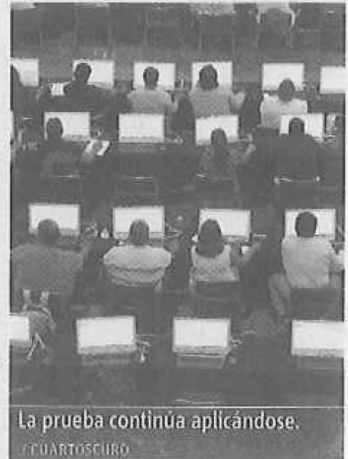
La prueba continúa aplicándose.