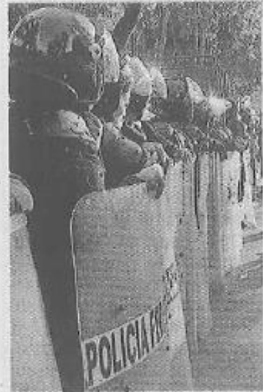
Policias federales vigilarán.

Explicó que la evaluación de Tabasco correspondió al proceso de ingreso a la educación básica,