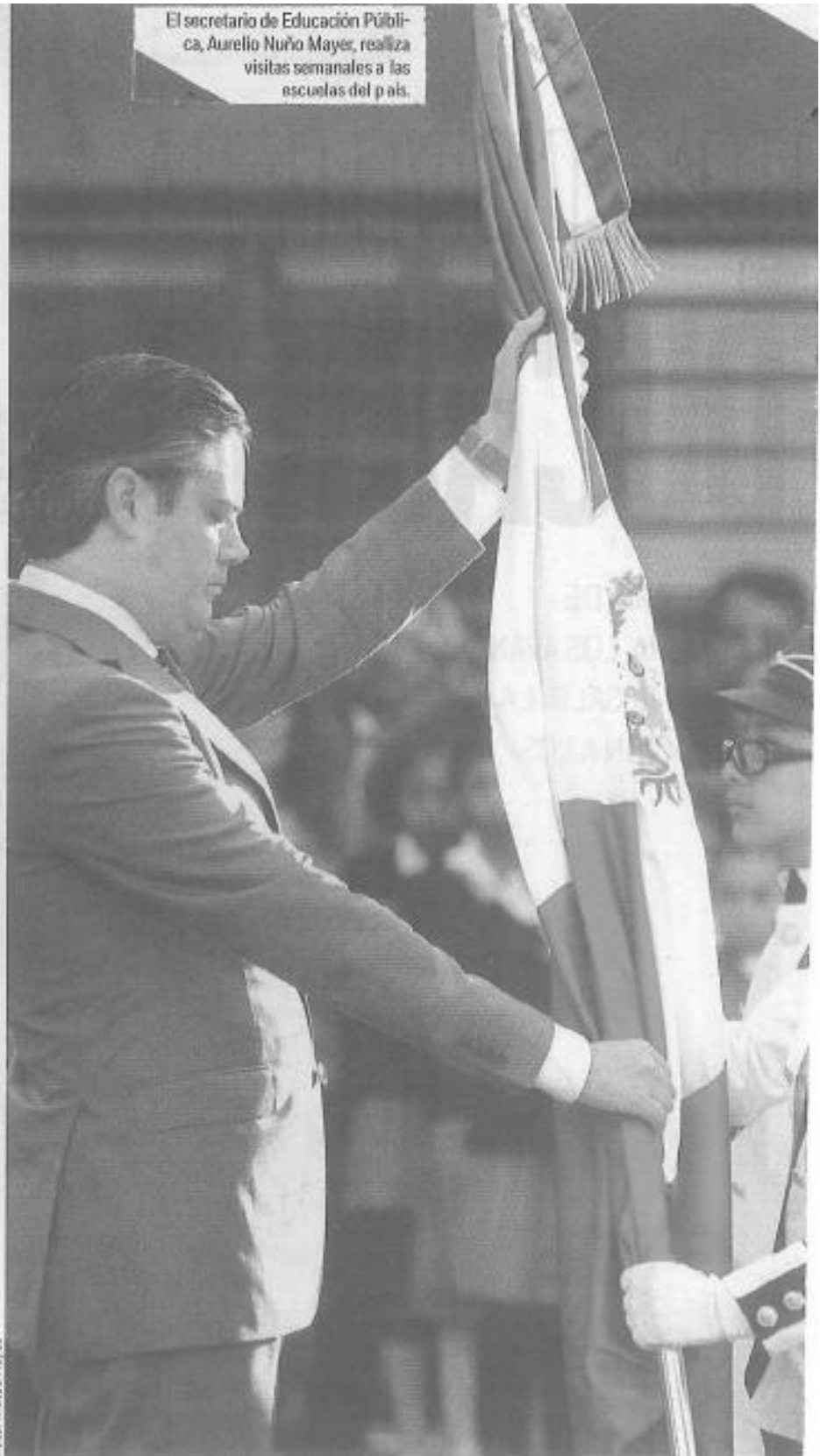
El secretario de Educación Pública, Aurelio Nuño Mayer, realiza visitas semanales a las escuelas del país.

Así que esta vieja leyenda de que, efectivamente, mejor no nos metamos con la Sección 22 o con la Coordinadora, porque más vale que estén tranquilos, entonces a cambio