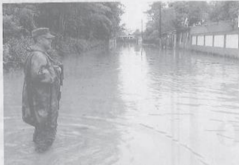
En los municipios con decreto de emergencia hay alrededor de cinco mil familias afectadas, se prevé que las lluvias continuarán.

En la capital del estado, Villahermosa, la lluvia ocasionó la caída de varios árboles en las principales calles de la