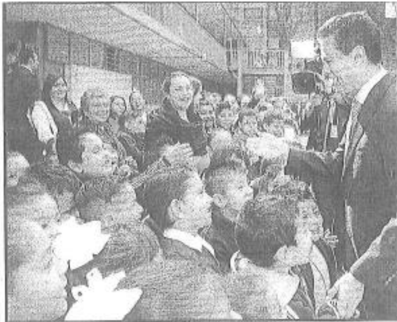
Enrique Peña Nieto visitó una primaria en el Centro de la Ciudad de México.