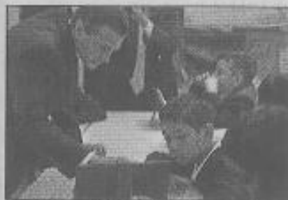
El gobierno de Peña Nieto ha reconocido que las principales carencias en las escuelas son el drenaje y la falta de agua.

Los datos gubernamentales refieren que en Oaxaca 78.9% de las escuelas públicas no dispone de drenaje, mientras que 57% no cuenta con agua de la red pública.