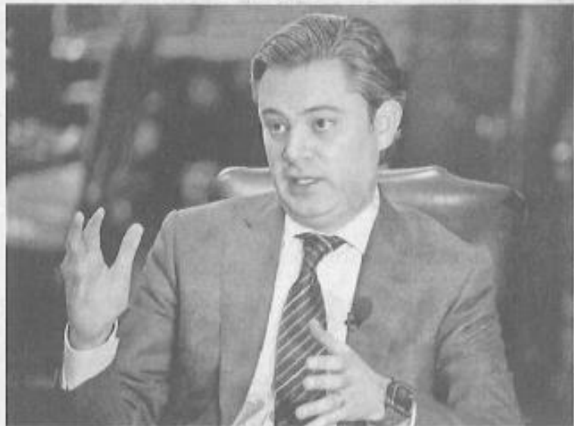
La reforma educativa es tan profunda que genera resistencias, dice el secretario de Educación Pública, Aurelio Nuño Mayer.

Es una reforma, señaló, que permitirá que la educación de todos los ni-