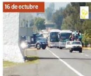
16 de octubre Alumnos de Tiripeño secuestraron una camioneta del gobierno de Morelia.