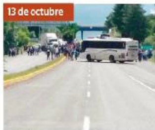
13 de octubre Normalistas retuvieron cinco autobuses de pasajeros y un camión repartidor.

En su lucha por plazas automáticas y en contra de la Reforma Educativa, pseudestudiantes de las normales michoacanas cometen delitos impunemente.