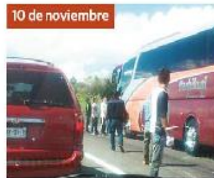
10 de noviembre Estudiantes retuvieron dos autobuses en la carretera Morelia-Pátzcuaro.