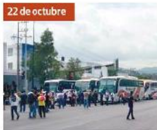
22 de octubre Se apoderaron de 11 autobuses y bloquearon vialidades de Morelia.