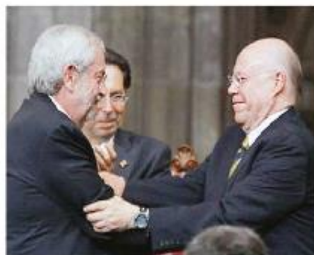
También saludó a su antecesor, José Narro.