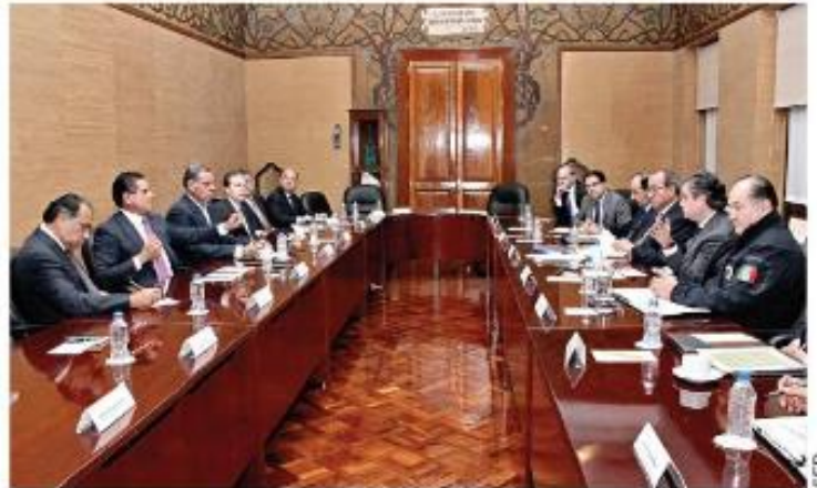
■ El titular de la SEP, se reunió con los mandatarios de Michoacán, Oaxaca, Guerrero y Chiapas para hablar de la evaluación educativa.

rios que los grupos que actúen fuera de la ley enfrentarán a un gobierno decidido a que se respete el Estado de Derecho y a la determinación de los maestros de participar en el proceso que los ayudará a mejorar su situación laboral.