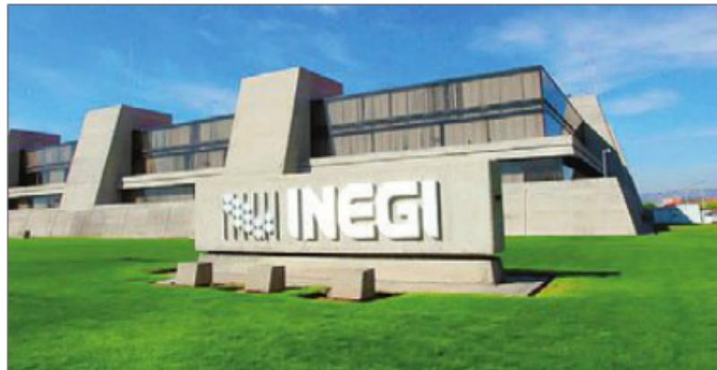
PROYECCIÓN. El INEGI tendrá 40 millones de pesos menos.

nes y Transportes (SCT) también se vio beneficiada con recursos adicionales por 7 mil 735 millones de pesos, resultado del incremento de 97 mil 482 millones 734 mil pesos que propuso la Federación, a 105 mil 217 millones 734 mil pesos en que quedó finalmente su presupuesto.