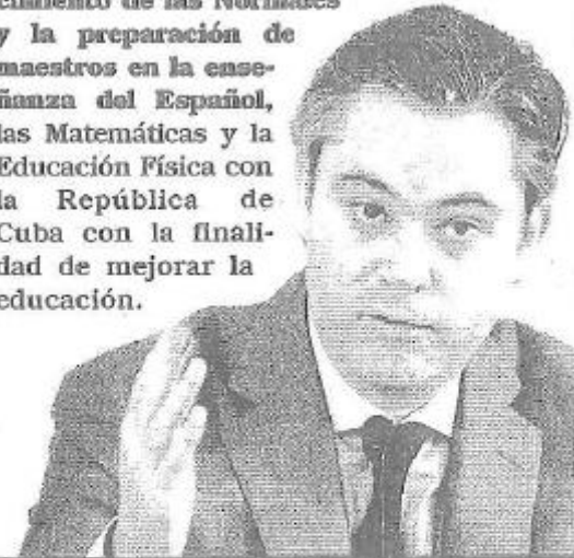
Aurelio Nuño Mayer

Adelantó que está en marcha un acuerdo educativo de alfabetización, lectura, fortalecimiento de las Normales y la preparación de maestros en la enseñanza del Español, las Matemáticas y la Educación Física con la República de Cuba con la finalidad de mejorar la educación.