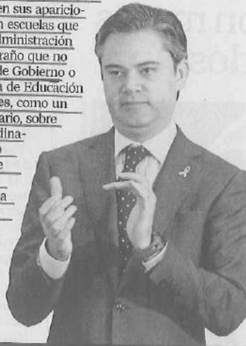
Aurelio Nuño Titular de la SEP

En el Antiguo Palacio del Ayuntamiento comenzaron a hacerse algunas preguntas sobre los constantes actos oficiales del secretario de Educación Pública, Aurelio Nuño , en el Distrito Federal. Si bien sus apariciones públicas han sido en escuelas que se encuentran bajo la administración de la SEP, les parece extraño que no se haya invitado al jefe de Gobierno o en su caso a la secretaria de Educación local, Alejandra Barrales , como un mero cumplido protocolario, sobre todo cuando existe coordinación en programas como Aliméntate y Escuelas de Tiempo completo, en el que el gobierno del DF ha invertido varios millones de pesos. ¿Don Aurelio ya les comienza a quitar el sueño rumbo a 2018?