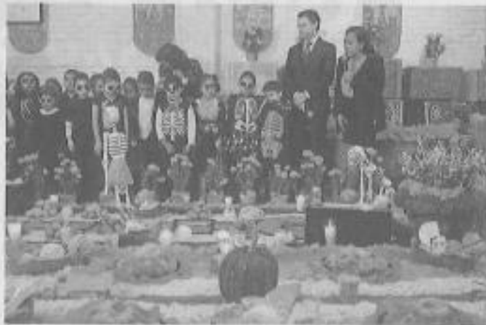
El secretario de Educación, Aurelio Nuño, visitó la Primaria 7 de Enero y convivió con los alumnos en el Día de Muertos.

"De 23 mil docentes que estaban convocados de media superior, incluso tenemos un excedente de profesores que voluntariamente accedieron, tenemos registrados a 26 mil maestros, es decir, 3 mil maestros más de media superior con todo y evidencias y están dados de alta en el sistema".