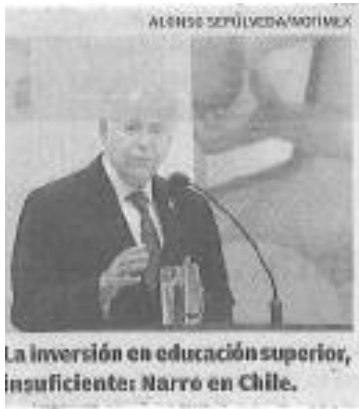
La inversión en educación superior, insuficiente: Narro en Chile.