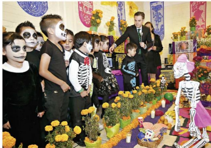
DÍA DE MUERTOS. El Secretario de Educación Pública, Aurelio Nuño, visitó la primaria "Siete de Enero", donde los niños le mostraron la ofrenda que montaron.

"Dedicamos muchas horas, más allá de las estrictamente