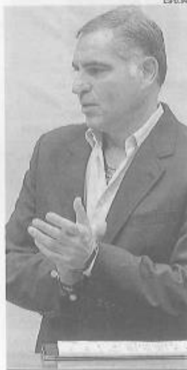
ORDEN. Gabino Cué, gobernador de Oaxaca, ayer.

Sin embargo, indicó que los maestros seleccionados que no la