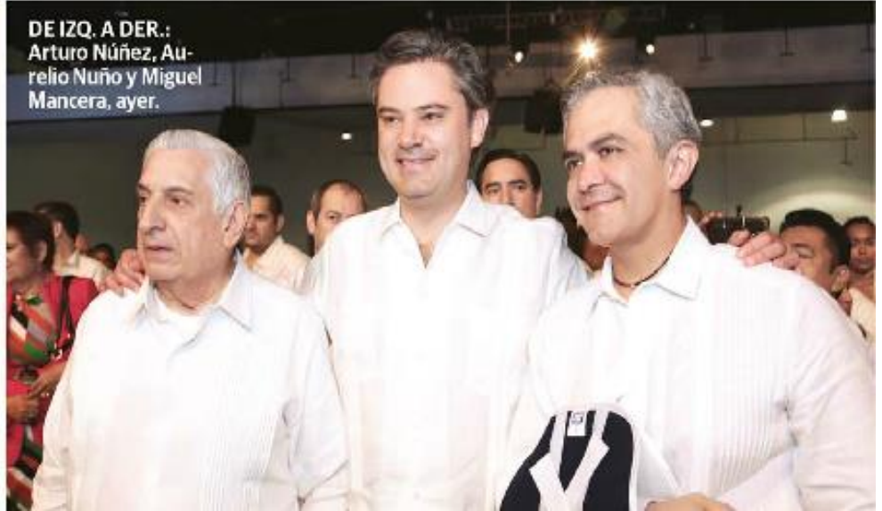
DE IZQ. A DER.: Arturo Núñez, Au- relío Nuño y Miguel Mancera, ayer.

EL JEFE DE GOBIERNO y el Secretario de Educación asistieron ayer al tercer informe de Arturo Núñez: "ha dado impulso económico a la entidad", afirma el mandatario capitalino.