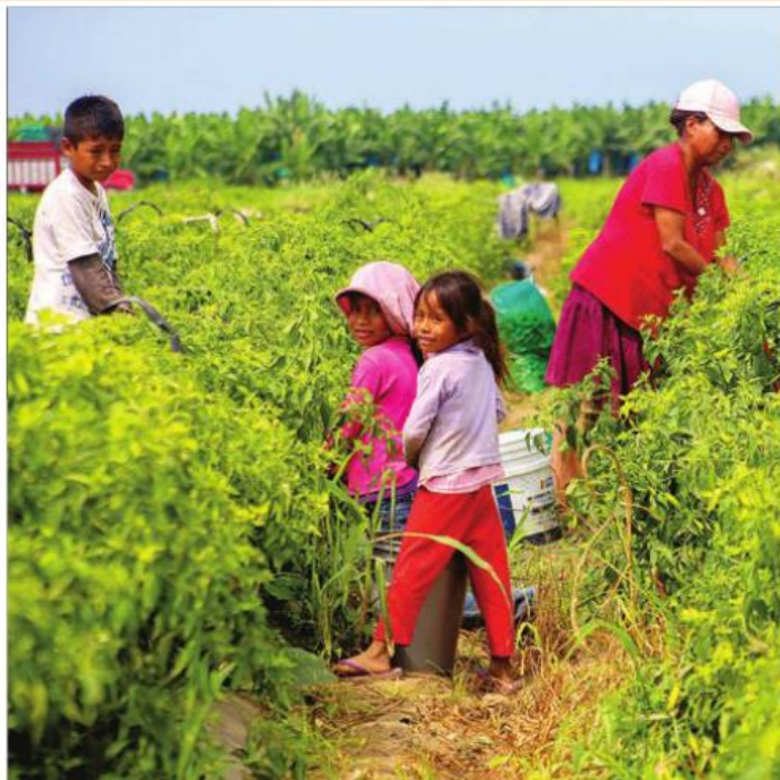
PRECAUCIÓN. Los pequeños no abandonan las zonas de cultivo, porque temen ser robados.

—Es muy alto, hablamos de un 60 por ciento. Sus padres se niegan a registrar-