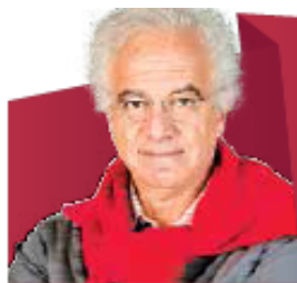
Cuentos políticos FRANCISCO MARTÍN MORENO fmartinmoreno@yahoo.com