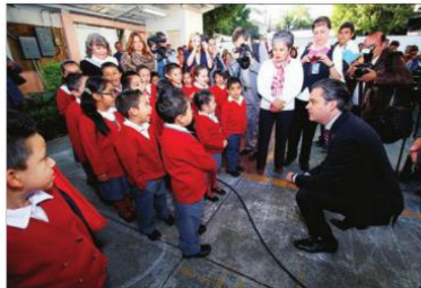
RESPECTO. Aurelio Nuño, titular de la SEP, negó que exista acercamiento con la CNTE.

En entrevista radiofónica, reiteró que este lunes 96 por ciento de las escuelas en todo el país funcionaron con normalidad, en Chiapas, el 95 por ciento; Gue-