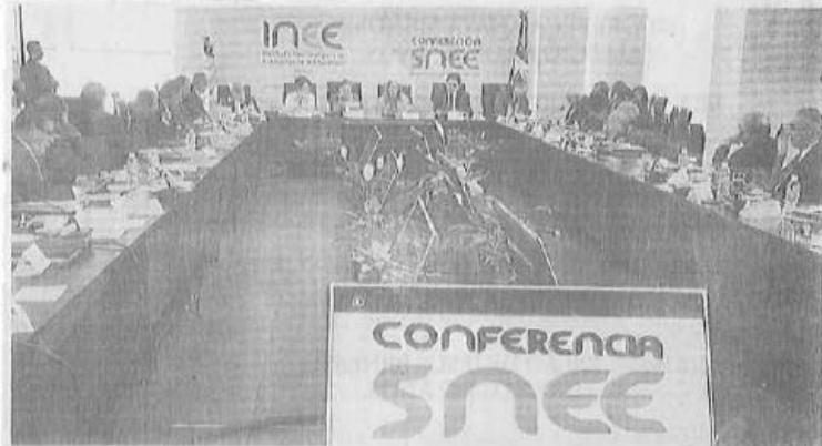
INTEGRANTES DE la conferencia del Sistema Nacional de Evaluación Educativa, realizaron su Segunda Sesión Ordinaria 2015.