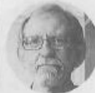
FRANCISCO BOLÍVAR ZAPATA

● Licenciado en Derecho por la UNAM. Se desempeñó como director general del Sistema Nacional de Información sobre Seguridad Pública.