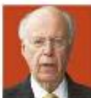
José Narro Robles Rector de la UNAM

Durante la inauguración del IV Congreso Latinoamericano de Antropología, Narro Robles dijo: "sí hace falta más ciencia y tecnología para resolver los problemas de siempre: pobreza, ignorancia, la muerte prematura, la corrupción, la impunidad o la injusticia y pienso que la respuesta es no más cien-