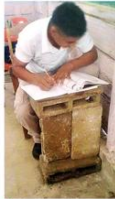
En lugar de mesabancos, en el telebachillerés 20, de Palenque, usan tabiques.

Además, el País cuenta con un Instituto Nacional para la