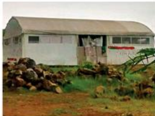
Bajo una carpa estudian los alumnos de la telesecundaria en la ciudad de Veracruz.