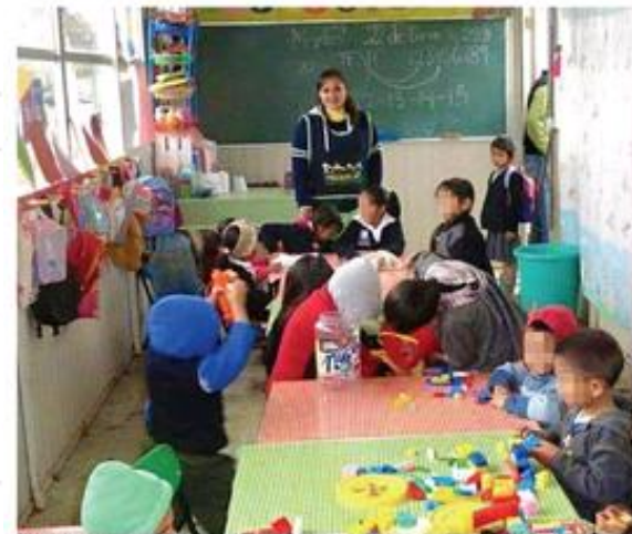
Una maestra de Zacatlán, Puebla, atiende a 40 menores de tres niveles en un remolque.

"La escuela se levantó con recursos de maestros y padres de familia, y ahora salieron beneficiados en un programa que ni siquiera es prioridad, cuando las condiciones exigen otro tipo de apoyo".