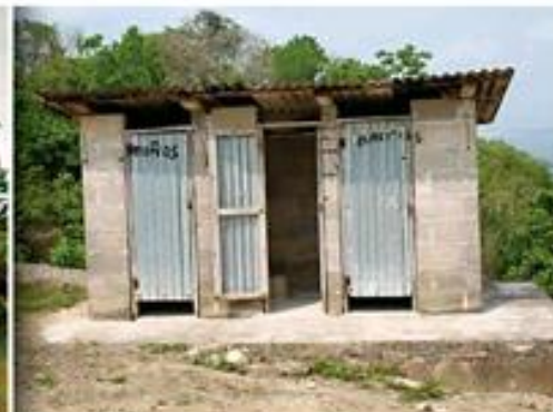
Condiciones de los baños de la primaria bilingüe en Huautla, Hidalgo.