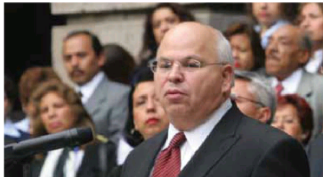
El subsecretario de Educación Media Superior de la SEP, Rodolfo Tuirán.

Esta modalidad educativa es idónea para jóvenes que quieren combinar su gusto por la tecnología con sus estudios, para quienes realizan actividades deportivas y/o culturales a nivel profesional, para trabajadores, amas de casa, personas con discapacidad y quienes habiendo concluido sus estudios de secundaria buscan iniciar, continuar o concluir su bachillerato. ©