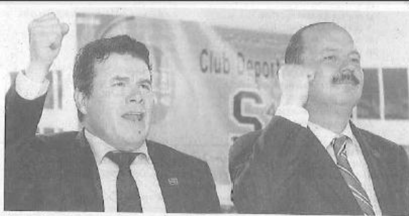
Juan Díaz de la Torre, presidente del SNTE, con el gobernador César Duarte durante su gira de trabajo por Chihuahua.

estado de Chihuahua, acompañado por el gobernador, César Duarte, Juan Díaz de la Torre señaló la necesidad de implementar una gran reforma al sistema de escuelas normales y formadoras de docentes.