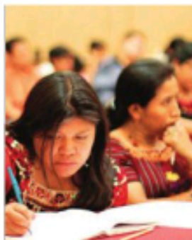
La mujer firmó un acuerdo bajo presión para abandonar la escuela.

Los hechos ocurrieron el 9 de noviembre de 2013, alrededor de las 6:00 de la mañana autoridades del ayuntamiento se presentaron en la casa de la mujer para lle-