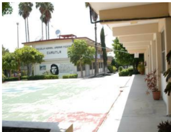
CONTINUAN EN paro de labores, personal docente y administrativo de la Escuela Normal de Cuautla.