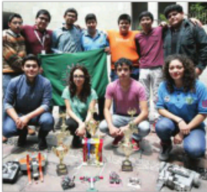
El equipo Mexbot consiguió un total de 10 medallas.