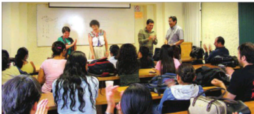
ANÁLISIS. Las condiciones académicas y laborales de los profesores de tiempo parcial son poco estudiadas en el país.