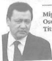
Miguel Ángel Osorio Titular de Segob

"Vamos hacia adelante y se va a lograr esta reforma que transformará la educación en nuestro país"