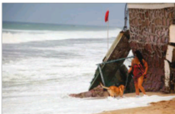
ALERTA. En el puerto de Mazatlán se registran altas olas por la tormenta tropical.

Luego de ser huracán de categoría 4, con vientos de hasta 215 kilómetros por hora (130 millas), el lunes Blanca era una tormenta tropical con vientos de 75 kph (45