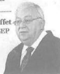
Emilio Chuayffet Titular de la SEP

"Nunca hubo el deseo de cancelar la evaluación porque se afectaría la reforma educativa"