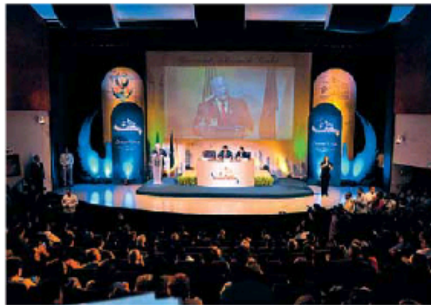
Casi siglo y medio de historia respalda a la institución.

Con este indicador, subrayó que la UAS se ubica como líder en