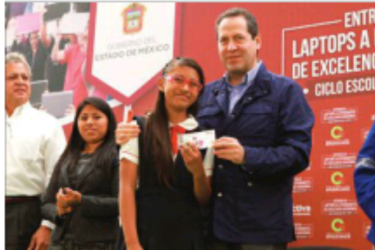
El gobernador Eruviel Ávila entregó laptops a alumnos de excelencia.

SEXTO DE PRIMARIA Y TERCERO DE SECUNDARIA