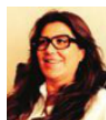
Mónica T. Arriola Gordillo

Senadora del Partido Nueva Alianza arriolamonica@hotmail.com