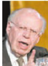
José Narro Robles

Las elecciones intermedias en México se han tomado como punto de referencia para realizar cambios en el primer círculo del presidente en turno, sobre todo de cara a la sucesión presidencial. La actual administración no está exenta. En los corrillos de la política ya suenan nombres para la siguiente tanda de relevos: Miguel Ángel Osorio Chong, Emilio Chuayffet y Aurelio Nuño . Incluso, en la lista de los que entrarían al quite han puesto al rector de la UNAM, José Narro Robles , que concluye su gestión al frente de la máxima casa de estudios en noviembre próximo.