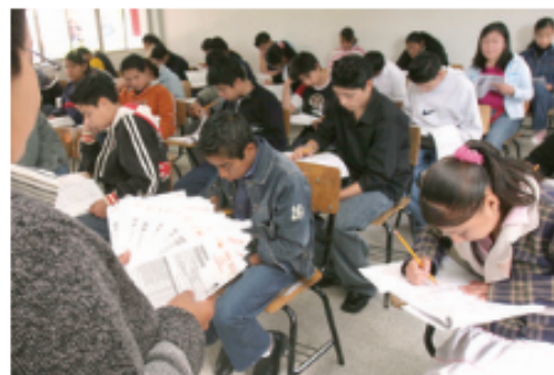
En Oaxaca de seis mil 41 estudiantes que se inscriben a las normales, sólo mil 242 egresan, de acuerdo con un informe del INEE.

Apunta que "estas cifras, que deben reducirse en virtud de que no todos los egresados normalistas cumplirán con los criterios de idoneidad, que impone el examen de oposición, revelan que con ellos no se alcanzarán a cubrir las vacantes".