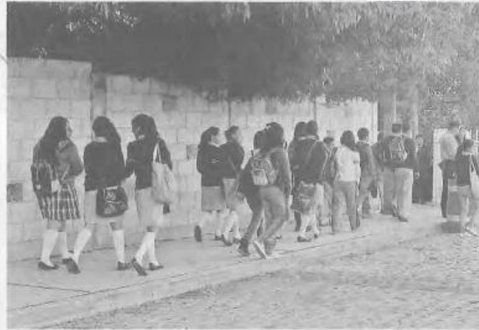
Más de 14 millones de estudiantes se reincorporan a las escuelas primarias.

De acuerdo con cifras de la Secretaría de Educación Pública (SEP), en preescolar reanudarán clases más de 4 millones 803 mil alumnos; en primaria, más de 14 millones 344 mil y en secundaria, más de 6 millones 821 mil.