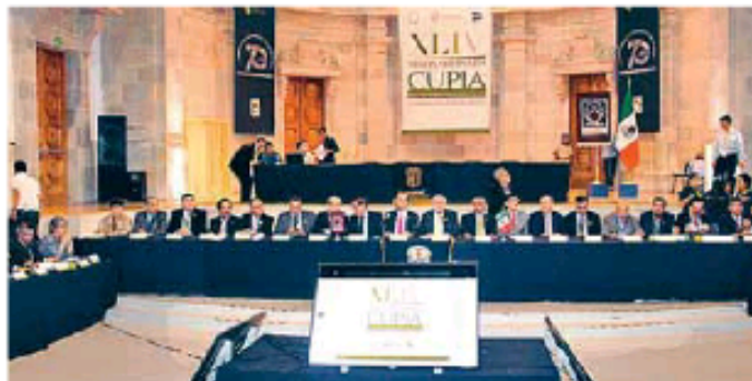
El consejo de la asociación analizó la problemática actual de la educación.

En primer lugar, las acciones que ha realizado la ANUIES como institución coadyuvante en la instrumentación del nuevo sistema de justicia penal que entrará en vigor en junio de 2016 en todo el territorio nacional. A este respecto, los rectores y directores miembros del Cupia informaron a la Secretaría Técnica del Consejo de Coordinación para la Implementación del Nuevo Sistema de Justicia Penal (Setec de la Secretaría de Gobernación, las actividades que desde 2008 han venido realizando, tales como la adecuación de sus planes y programas de estudio, así como de