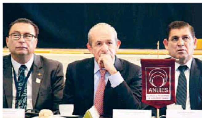
Los titulares de las instituciones que conforman la asociación plantearán propuestas al Ejecutivo en los próximos meses.

“En general todas las universidades necesitan más recursos para poder cumplir con el Plan Nacional de Desarrollo y en programa sectorial de educación. La meta para el 2018 es cobertura del 40 por ciento la cifra