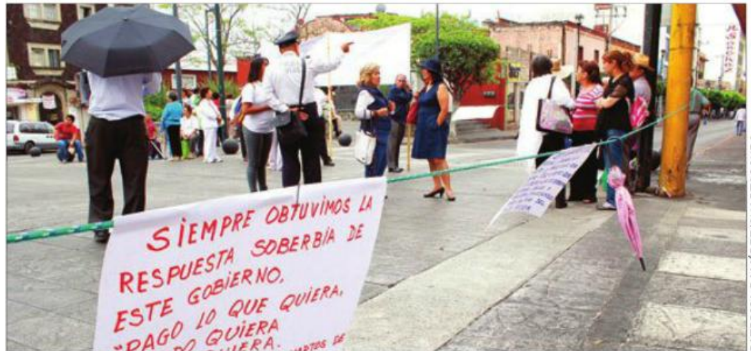
MENSAJES. Las jubiladas tomaron avenidas durante casi cinco horas.

Los profesores jubilados del nivel básico del estado bloquearon por más de cinco horas varias avenidas de Cuernavaca, situación que generó un severo caos vial al exigir el pago de 50 días de aguinaldo