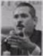
Manlio Fabio Beltrones

La salida de Marcelo Ebrard no queda ahí. Diversos cuadros perredistas, principalmente de Movimiento Progresista, alistan ya sus cartas de renuncia para seguir los pasos del ex jefe de gobierno del Distrito Federal. La renuncia masiva será en los próximos días a pocos meses de las elecciones intermedias. El presidente nacional del partido, Carlos Navarrete , asegura que están completos y de pie, pero es un hecho que el sol azteca se va haciendo pequeño y Los Chuchos parecen conformes con las salidas, mientras ellos mantengan el control de lo que quede de pie del partido.