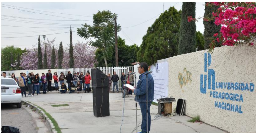
Plantón. Maestros y alumnos realizan plantón a las afueras de la UPN para exigir salida del director. (Alejandro Alvarez)