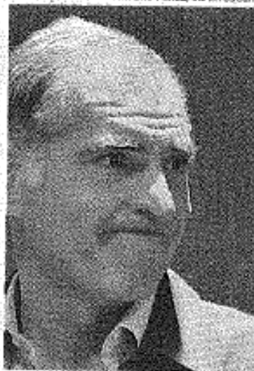
El mandatario oaxaqueño.

En entrevista, dijo que las continuas movilizaciones de los profesores