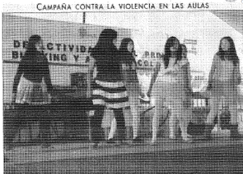
Con obras de teatro y otras representaciones artísticas desarrollaron ayer los estudiantes del proyecto contra la violencia y el acoso escolar en la secundaria Cuauhtémoc, en Mérida, estado del Yucatán.