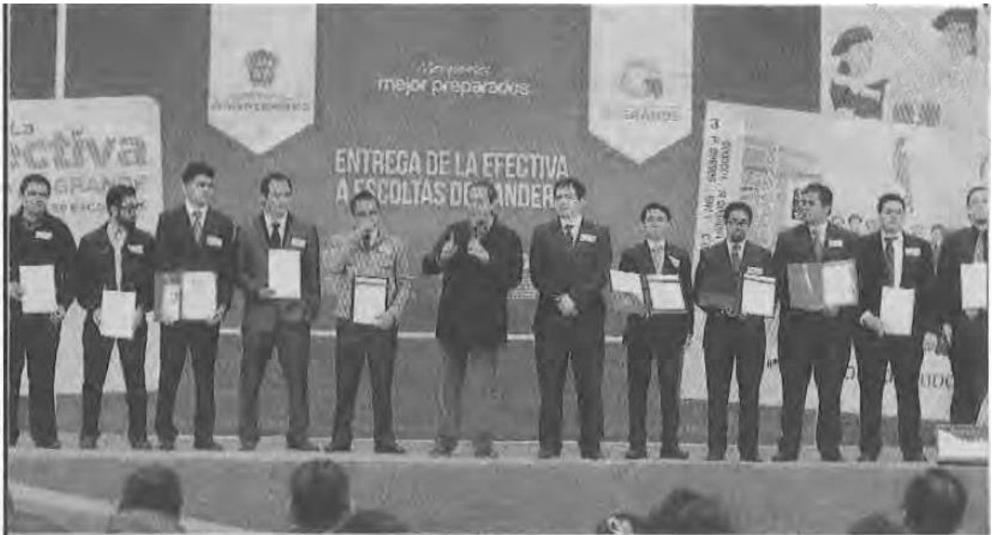
Cuautitlán, México.- Durante la entrega de apoyos del programa Acciones por la Educación, el gobernador Eruviel Ávila Villegas entregó becas y laptops a los once estudiantes mexicanos que ganaron el segundo y tercer lugar en el concurso internacional de robótica denominado All Japan-International Robot Sumo Tournament 2014, a quienes calificó como un ejemplo a seguir por parte de los más de 4 millones de alumnos que hay en el Edomex. Este certamen es considerado como uno de los más importantes a nivel mundial en la categoría de robots de competencia de Sumo, donde asistieron participantes de países como Turquía, Brasil, Lituania y Japón.