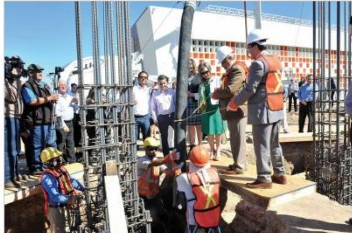
Colocan autoridades primera piedra de nuevo edificio de Investigación Virtual en el Centro Regional de Formación Docente de Sonora.

Agregó que el nuevo espacio servirá para la realización de actividades magnas como seminarios, conferencias, presentaciones y graduaciones de programas académicos, entre otros.