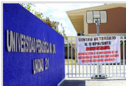
Las maestros afiliados al SNTE, insistieron en que es una violación a sus derechos laborales.

En la UPN, que cumplió en diciembre sus 35 años de creación, reciben clases alrededor de 200 estudiantes de licenciatura así como de maestrías, relacionadas con el ámbito educativo.