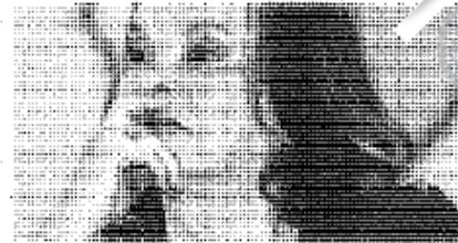
Elba Esther Gordillo Exdirigente del SNTE

● Después de casi cuatro meses de investigación, la PGR obtuvo un orden de aprehensión contra el exedil de Iguala por el secuestro de los 43 normalistas de Ayotzinapa. Asimismo, un juez ordenó una nueva captura contra su esposa por delincuencia organizada.