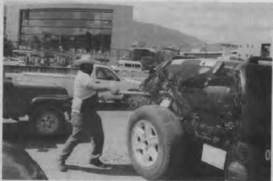
Los maestros disidentes de Guerrero radicalizaron sus acciones para exigir la presentación con vida de los 43 normalistas desaparecidos.

En el auditorio Sentimientos de la Nación, donde se realizaba el foro "Jóvenes emprendedores", organizado