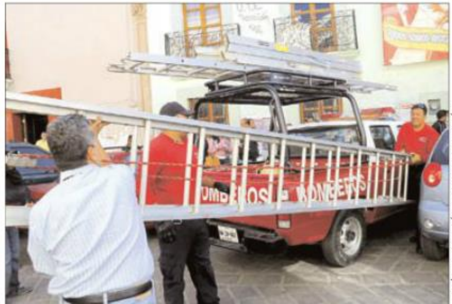
JOSÉ LUIS JERÓNIMO / QUADRATÍN

ENTREGA. Los bomberos revisaron las condiciones generales del equipo sustraído.