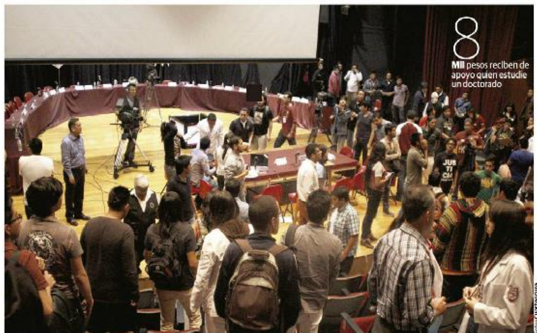
LA ÚLTIMA asamblea entre los paristas y las autoridades del gobierno, el pasado 25 de noviembre.

LA NORMATIVA impide que los estudiantes de maestría y doctorado puedan buscar otro ingreso económico; afirman que los paristas no han escuchado sus opiniones