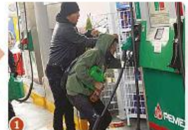
1 DE DICIEMBRE 2012 saqueó una gasolinera.