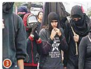
19 DE ABRIL 2012 fue uno de los vándalos que tomaron la Rectoría de la UNAM.