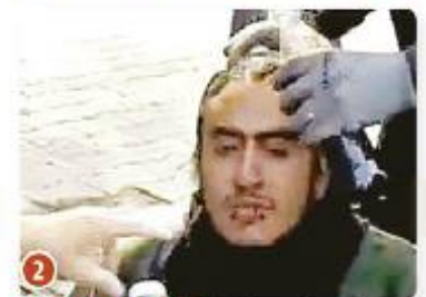
1 DE DICIEMBRE 2012 lanzó petardos en la Cámara de Diputados.

de 2012 al lanzar petardos a la Cámara de Diputados, ese mismo día fue captado mientras robaba en una gasolinera del centro. Además se le responsabiliza de incendiar instalaciones en CCH Naucalpan el 5 de febrero de 2013.