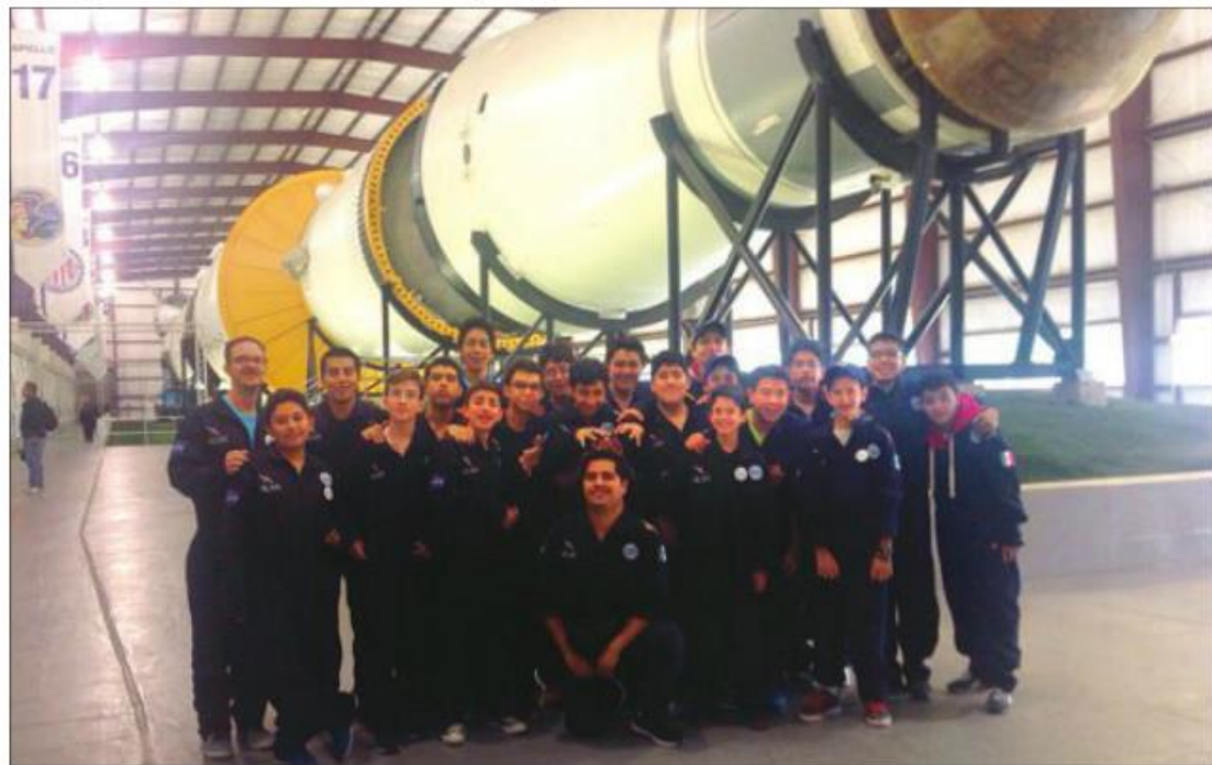
TORNEO. Los equipos de RobotiX participaron en la competencia realizada en el Centro Espacial Johnson de la NASA.

El primer lugar, obtenido por los RobotiX Marsabots, se hizo acreedor a un certificado para un