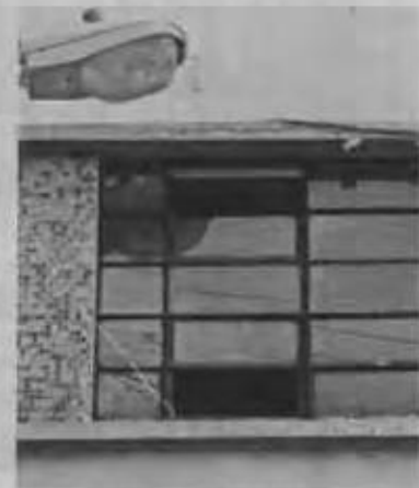
■ El plantel de la Santa María La Ribera requiere mantenimiento mayor.

REFORMA publicó el domingo que la reconstrucción de la Secundaria 46 había sido abandonada apenas una semana después de que comenzó.