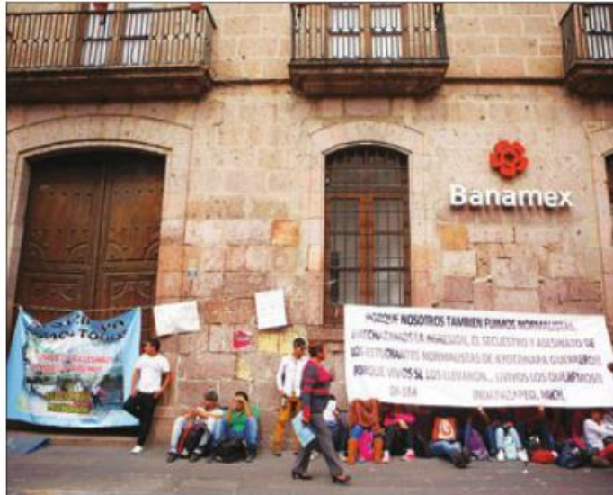
Fueron 62 sucursales bancarias de Banamex las que cerraron sus puertas al público en el territorio michoacano

En total fueron 62 sucursales bancarias de Banamex las que