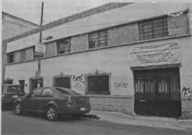
■ La Escuela Secundaria 46 José Vasconcelos será reconstruida en una parte, para lo que se invertirán 4 millones de pesos.

Fernández afirmó que en gestiones realizadas en la Cámara de Diputados se consiguió el compromiso del diputado federal José Luis Muñoz Soria de que se etiquetarán 4 millones de pesos para las obras en este plantel, ubicado