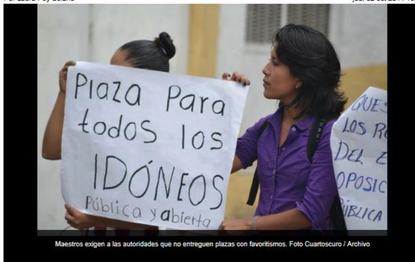
Maestros exigen a las autoridades que no entreguen plazas con favoritismos.

México, DF. La Secretaría de Educación Pública (SEP) informó que para este año escolar y el ciclo 2015-2016 contará con 15 mil tutores para maestros de nuevo Ingreso, quienes tendrán la asesoría de estos docentes, de acuerdo con la establecido por la reforma educativa.