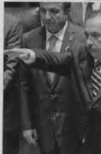
Rindió protesta en el pleno.

De acuerdo con la ficha que fue circulada en el Senado, tiene amplia experiencia en el sector público en diversas tareas de administración, de evaluación, de control y de transparencia