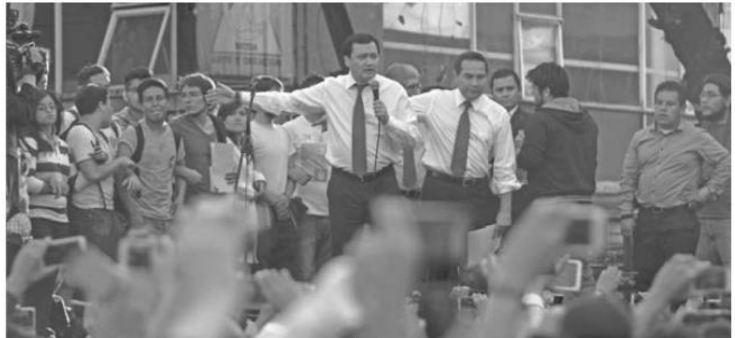
Todo comenzó, repentinamente, el martes pasado. Miguel Ángel Osorio Chong y estudiantes tuvieron el primer encuentro

MIENTRAS LOS ALUMNOS DEL IPN DABAN A CONOCER SU PLIEGO PETITORIO CONTRA EL NUEVO REGLAMENTO INTERNO, EL RESPONSABLE DE LA POLÍTICA INTERIOR DEL PAÍS ESCUCHABA Y, LUEGO, PROPONÍA LA INSÓLITA REUNIÓN CULMINÓ, EL PRIMER DÍA, CON UNA TANDA DE APLAUSOS PARA MIGUEL ÁNGEL OSORIO CHONG; EL VIERNES DIO RESPUESTA AL PLIEGO PETITORIO Y ANUNCIÓ LA ACEPTACIÓN DE LA RENUNCIA DE LA DIRECTORA YOLOXÓCHITL BUSTAMANTE