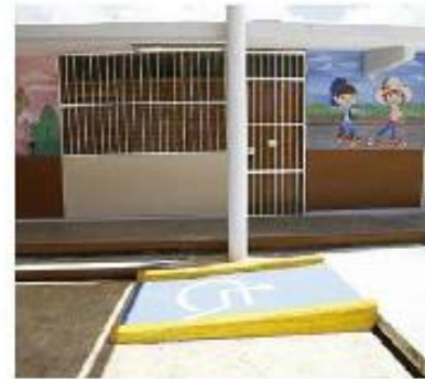
RAMPA para alumnos con problemas motrices en un plantel del estado.

El funcionario estatal destacó que el gobernador de la entidad dispuso la