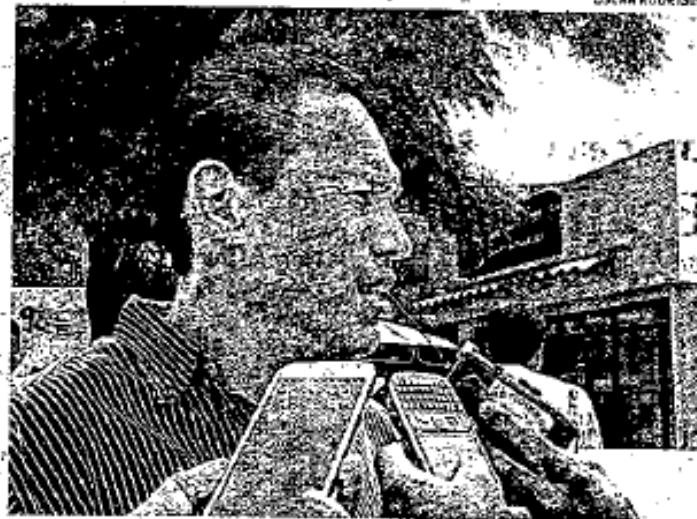
El vocero de los profesores disidentes en la entidad.