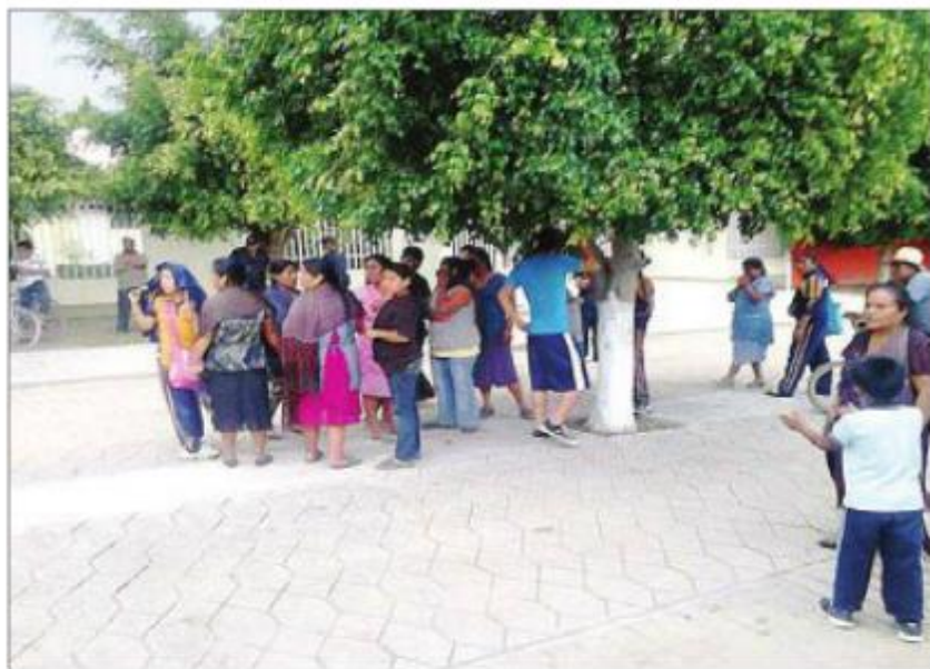
PRESIÓN. Los pobladores mantenían a los profesores adentro de la telesecundaria.

La Procuraduría detuvo al ex síndico municipal por su participación en una riña ocurrida en