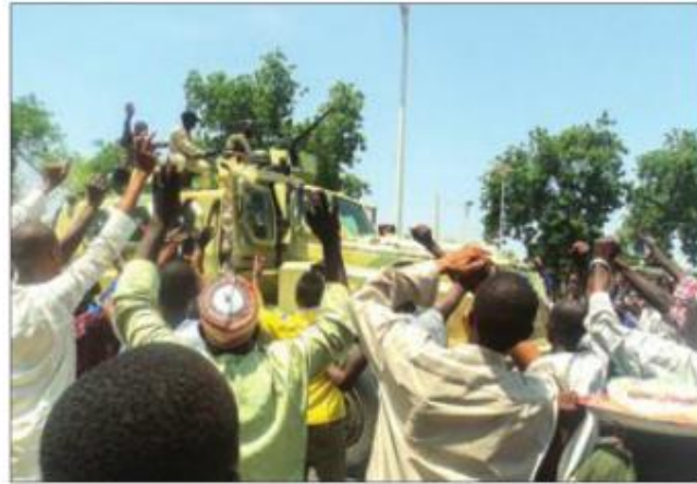
Civiles de Maiduguri ovacionan a soldados nigerianos por su victoria sobre islamistas en Konduga.

El comisario de policía de la región de Kano, Aderinle Shinaba, reveló que, tras el tiroteo, los agresores irrumpieron en una sala de conferencias donde dos extremis-