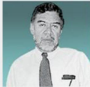
Carlos Pallán Figueroa

Entre las intervenciones ahí efectuadas, destaca la del director general del Conacyt, toda vez que en las palabras por él pronunciadas se contienen principios de solución a problemas y fallas del SNI largamente planteadas y percibidas por sus integrantes. Entre los aspectos anunciados por el Dr. Cabrero destacan los siguientes: a) deberá buscarse más calidad en el sistema, durante mucho tiempo se ha privilegiado la cantidad; b) algo similar deberá hacerse en lo que toca a la investigación colectiva, se le ha dado una importancia enorme a la de tipo individual; c) deberá impulsarse más el trabajo relacionado con la investigación y el desarrollo tecnológico así como la vinculación con el sector productivo, situación que deberá llevar a reconocer de manera más amplia este tipo de actividades; d) la evaluación deberá ser más amplia, atendiendo a resultados y al desempeño de los investigadores, abarcando aspectos como los anteriormente mencionados y no centrándose, por lo tanto, sólo en la parte correspondiente a publicaciones; e) el trabajo in-