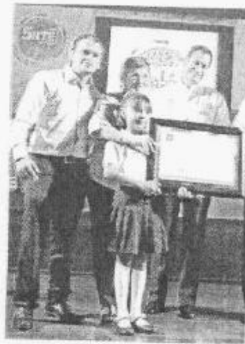
LABOR. El gobernador Mario Anguiano puso en marcha el proyecto ecológico

Se explicó que las acciones de este proyecto serán desarrolladas, mediante una Comisión Nacional y subcomisiones seccionales, con una filosofía inclu-